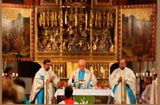
14./15. September - Erzbischof em. Dr. Robert Zollitsch