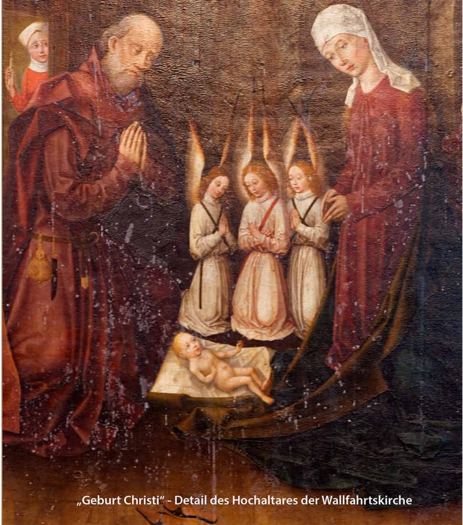
„Geburt Christi“ - Detail des Hochaltares der Wallfahrtskirche