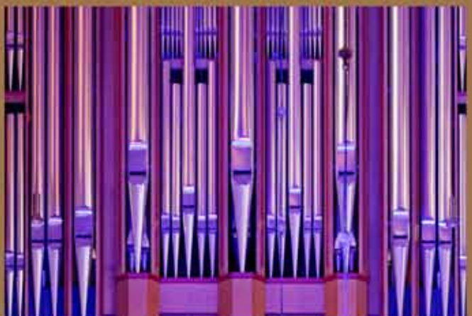
26. November - Jubiläumskonzert