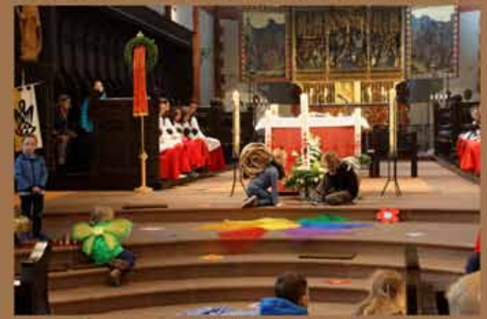
17. April - Kindergottesdienst