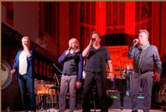
19. September - Die Prinzen