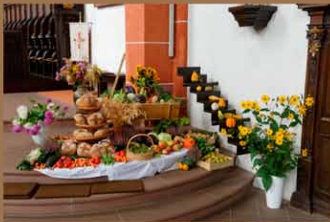
1. Oktober - Erntedank