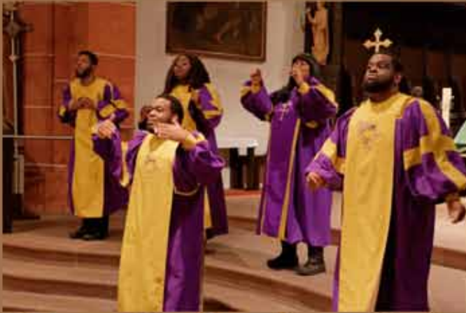
22. Januar - Glory Gospel Singers, New York