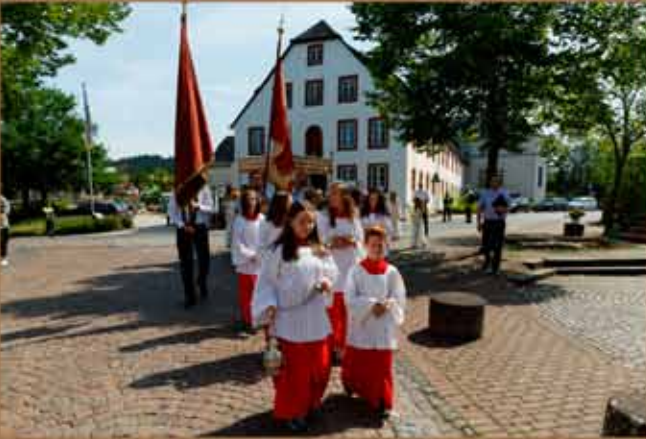
15. Juni - Fronleichnam