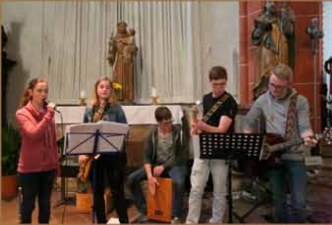
12. Mai und 4. Nov. - Jugendgottesdienst