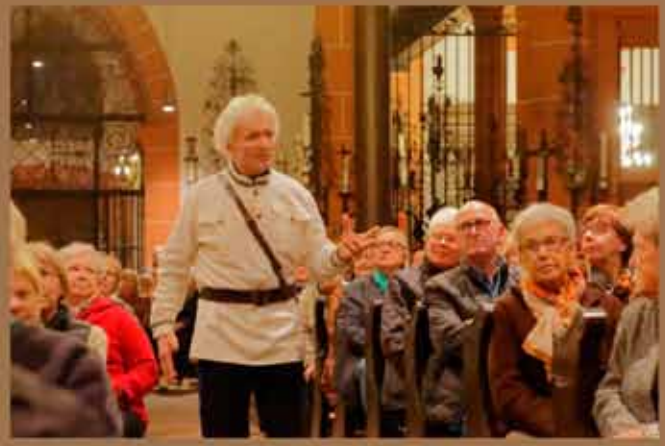
13. Oktober - P. Orloff/Schwarzmeerkosaken