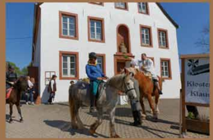
29. April - Pferdesegnung