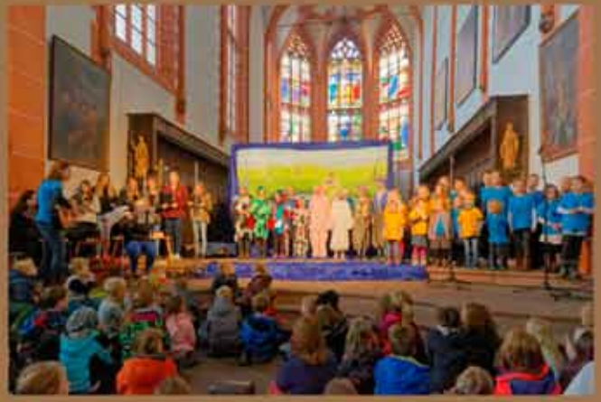
5. November - Musical Friedolin