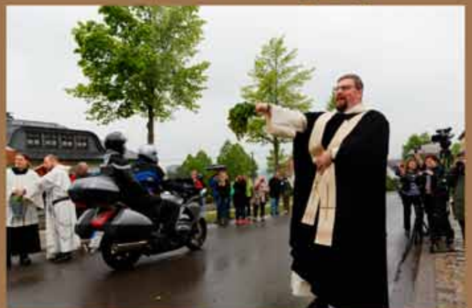
07. Mai - Motorradwallfahrt